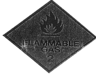
অতি প্রজ্বলনীয় গ্যাস