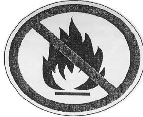
খোলা শিখা নিষিদ্ধ