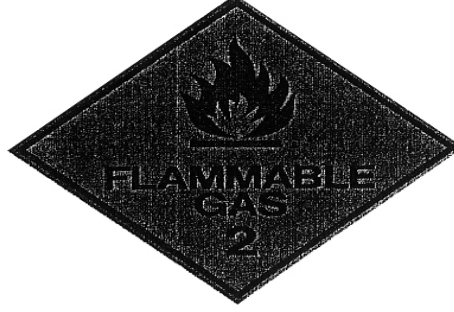
অতি প্রজ্বলনীয় গ্যাস

“(৪) প্রত্যেক এলপিগ্যাস স্থাপনা বা মজুদাগারে নিম্নবর্ণিত সতর্কবাণী এবং প্রতীক ব্যবহার করিতে হইবে, যথা:—