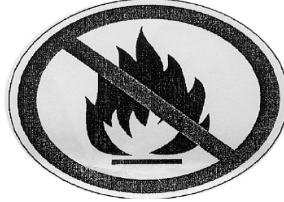
খোলা শিখা নিষিদ্ধ